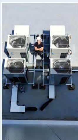
Mooiste foto Martin Hartman CoolCareHolland